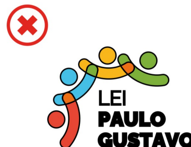
Não utilizar contornos