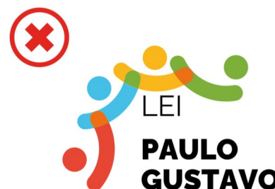
Não desalinhar os elementos