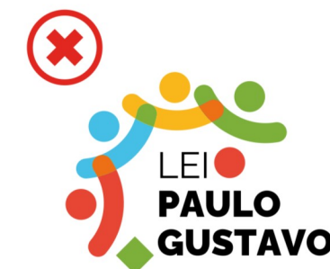
Não inserir elementos não previstos