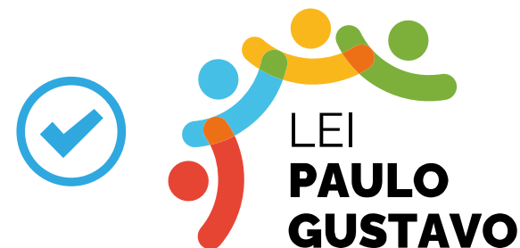
Exemplo de fundo permitido

Obs.: nos casos em que o fundo for da mesma tonalidade das cores do logo, e não puder ser alterado (de forma alguma), utilizar outras versões.