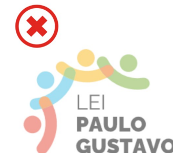
Não alterar a opacidade